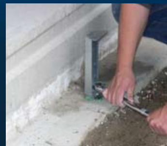
aandraaien m.b.v. momentsleutel