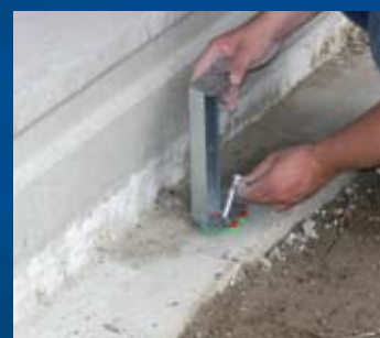
plaatsen Drukplaten met sleuf