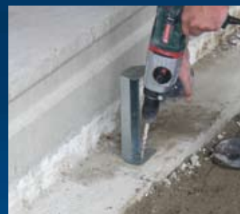
plaatsen Pui-steunen/gat boren