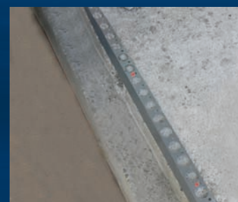
gereed - aanbrengen zandcement dekvloer