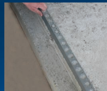
ondergrond stofvrij maken en aanbrengen Hoeklijn