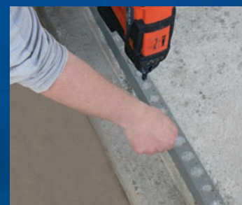
bevestigen Hoeklijn - min. 2 nagels per lengte