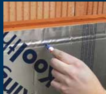
plaatsen isolatie en bepalen plaats UNI-Perfoplug