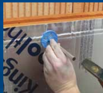
aanbrengen UNI-Perfoplug en inslaan m.b.v. Inslaghulp