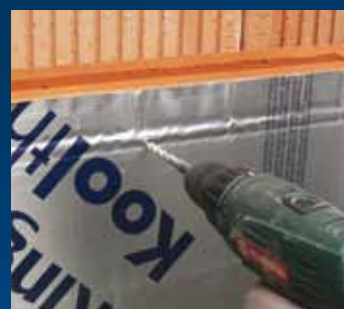
gat boren Ø8 mm