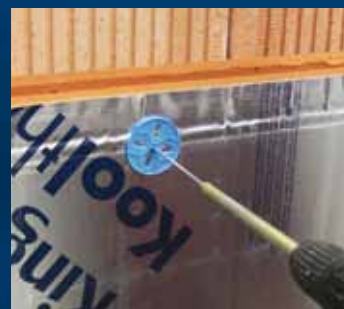
indraaien UNI-Bouwsouwanker m.b.v. Indraaihulpstuk